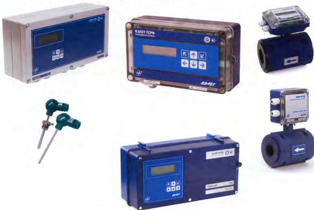
Рисунок 1 - Общий вид теплосчетчиков - регистраторов «ВЗЛЕТ ТСП-М»

Общий вид теплосчетчиков приведен на рисунке 1.