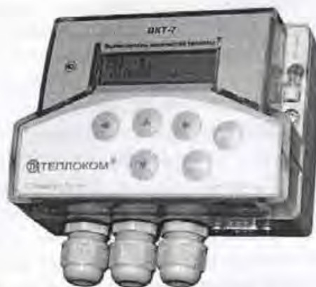
Рисунок 1 – Внешний вид вычислителя

Внешний вид вычислителя приведен на рисунке 1.